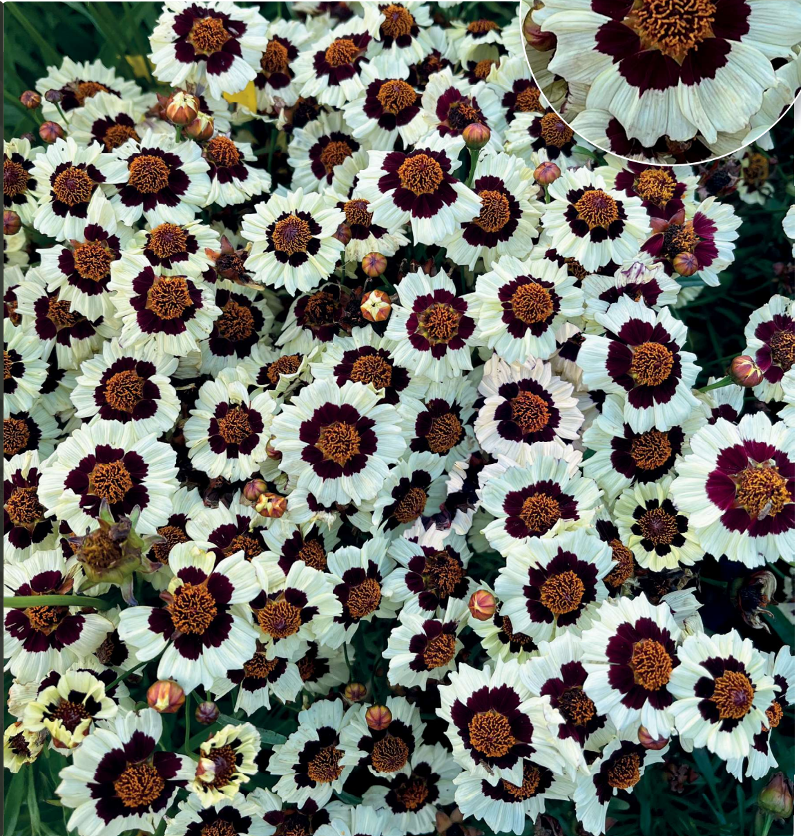
Corusco Cream-Red, een echte tuin must-have voor de lente!

Ben je op zoek naar een opvallende, vroeg bloeiende plant om je tuin op te fleuren? Coreopsis Corusco Cream-Red , veredeld door Van Hemert & Co, is een echte must-have voor in de tuin. Dit innovatieve laagblijvend ras heeft tal van crèmekleurige bloemen met dieprood accent en is een zeer welkome aanvulling op het bestaande Coreopsis tinctoria assortiment. Corusco Cream-Red heeft weinig onderhoud nodig, trekt bijen en vlinders aan en is goed bestand tegen droogte. Van deze nieuwe winnaar met opvallende kleurencombinatie en compacte plantvorm